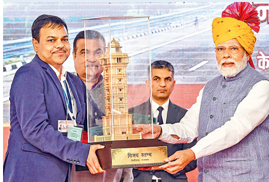
कांग्रेस सरकार पर कटाक्ष

अपनी सरकार द्वारा समाज के वंचित तबके के लिए किए गए कामों को प्रमुखता से सामने रखते हुए प्रधानमंत्री नरेंद्र मोदी ने रविवार को कहा कि उनकी सरकार ने 'वंचितों को वरीयता' दी है और वह 'विरासत भी, विकास भी' का मंत्र लेकर आगे बढ़ रही है। इसके साथ ही मोदी ने कहा कि अब भारत ने विकसित बनने का संकल्प लिया है और विकसित भारत बनने के लिए भारत का तीव्र विकास बहुत जरूरी है। मोदी दिल्ली-मुंबई एक्सप्रेस-वे के एक खंड का उद्घाटन करने के बाद घनाड़ (दौसा) में आयोजित सभा को संबोधित कर रहे थे। मोदी ने कहा कि पिछले नौ वर्षों में हमने उन क्षेत्रों एवं उन वर्गों पर भी विशेष ध्यान दिया है जो विकास से वंचित थे। हमने वंचितों को वरीयता दी है। गरीब हो, दलित हो, पिछड़े हो, आदिवासी हो, छोटे किसान हो, हर वर्ग का हमने ध्यान रखा है।" उन्होंने कहा कि आल इंडिया मॉडिकल कोट में ओबीसी के लिए आरक्षण नहीं था, हमने यह भी सुनिश्चित किया है।" उन्होंने कहा कि बीते नौ वर्षों से केंद्र सरकार सड़क, रेल, गरीबों के लिए घर, हर घर में जल, बिजली ऐसे हर बुनियादी ढांचे पर पैसा खर्च कर रही है। उनका कहना था कि इस बार के बजट में भी गरीब, गरीब की सुविधाएं बढ़ाने के लिए सबसे अधिक बल बुनियादी ढांचे पर दिया गया है। आज देश विरासत भी विकास भी इस मंत्र को लेकर आगे बढ़ रहा है।