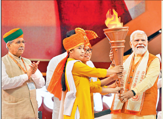
मोदी ने दर्यान्द सरस्वती के 200वें जयंती समारोह का उद्घाटन किया

नई दिल्ली (भाषा)। प्रधानमंत्री नरेंद्र मोदी ने रविवार को कहा कि भारत पूरे स्वामिमान के साथ अपनी विरासत पर गर्व रहा है और इस बात पर जोर दे रहा है कि वह आधुनिकता लाने के साथ ही अपनी परंपराओं को मजबूत करेगा। मोदी ने यह भी कहा कि देश की नीतियों और प्रयासों में कोई मेढभाव नहीं है और इसका उद्देश्य गरीबों, पिछड़ों तथा वंचितों की प्राथमिकता के साथ सेवा करना है। मोदी ने समाज सुधारक एवं आर्य समाज के संस्थापक दयानंद सरस्वती के 200वें जयंती समारोह का उद्घाटन करने के बाद यह बात कही। प्रधानमंत्री ने जयंती समारोह के 'लोगो' का भी अनावरण किया। उन्होंने कहा कि भारत पर्यावरण के क्षेत्र में दुनिया को रास्ता दिखा रहा है। प्रधानमंत्री ने यह भी कहा कि यह गर्व का बात है कि भारत इस साल जी20 की अध्यक्षता कर रहा है।